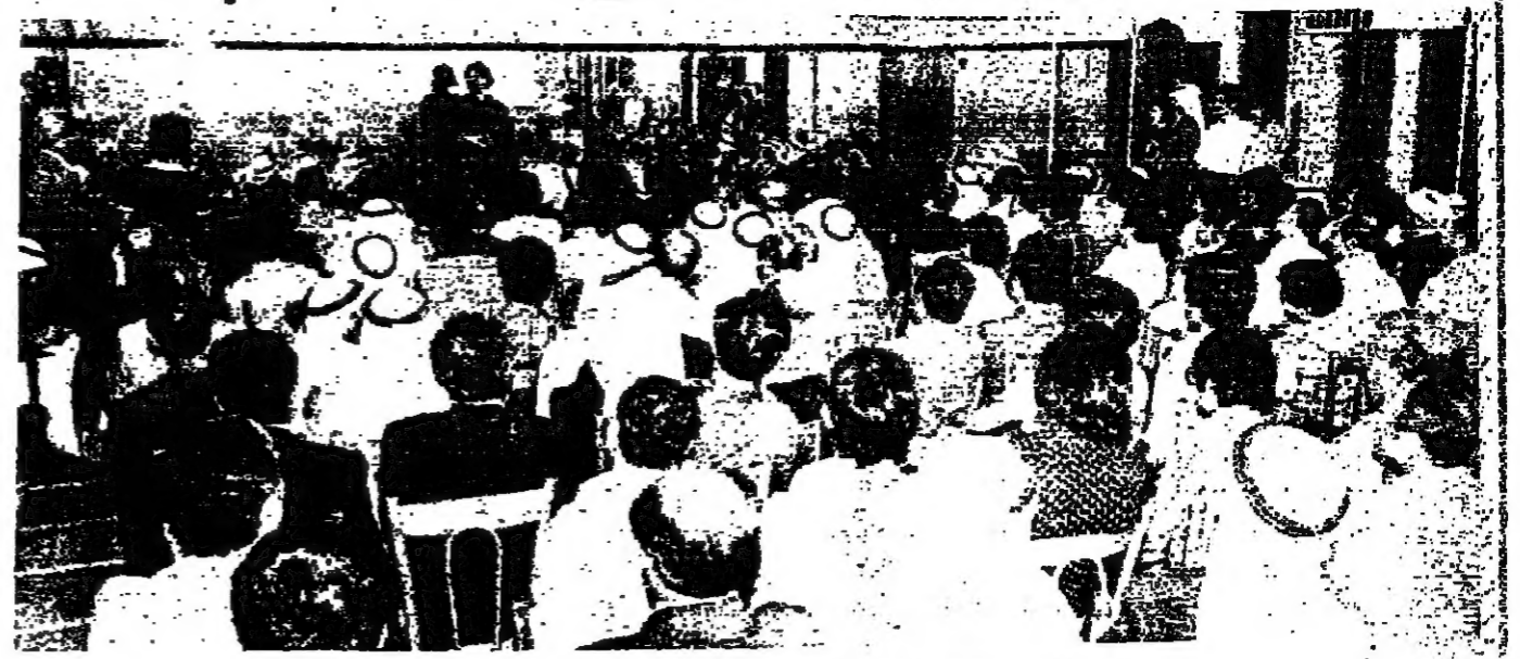
الامام الصدر يتحدث في لقاء المصالحة أمس